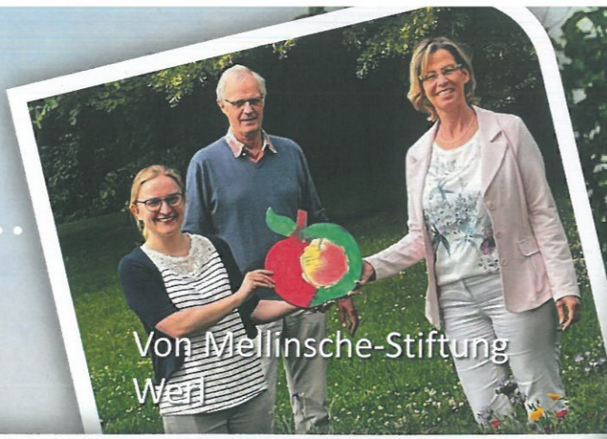
Von Mellinsche-Stiftung Werl

und Gerechtigkeit vom Himmel schaue Ps. 85,12