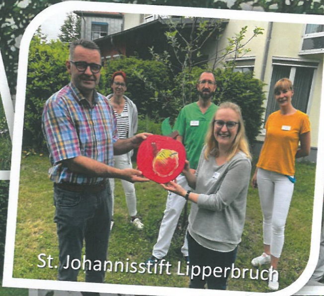
St. Johannisstift Lipperbruch