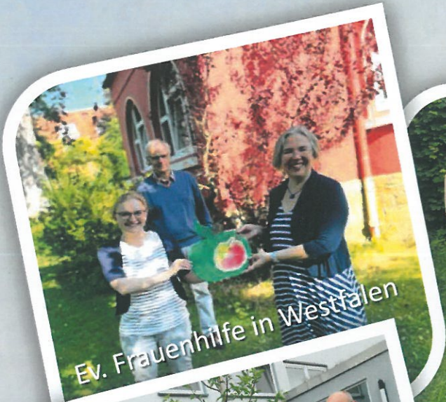
Ev. Frauenhilfe in Westfalen