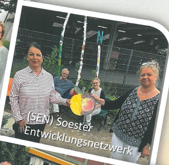
(SEN) Soester Entwicklungsnetzwerk