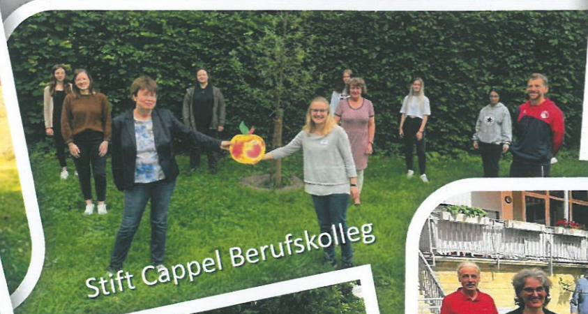
Stift Cappel Berufskolleg