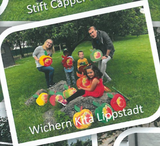
Wichern Kita Lippstadt