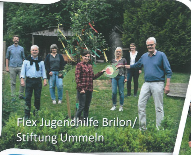
Flex Jugendhilfe Brilon/ Stiftung Ummeln