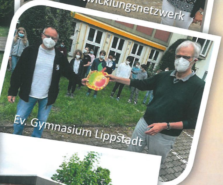
Ev. Gymnasium Lippstadt