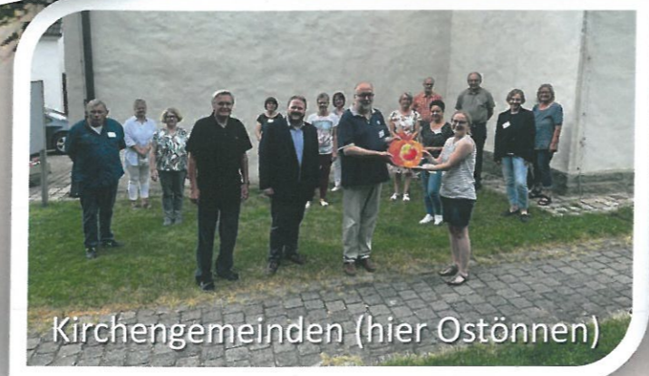
Kirchengemeinden (hier Ostönnen)