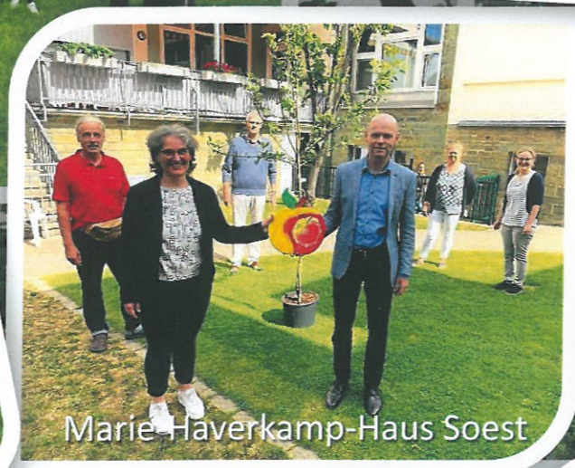
Marie Haverkamp-Haus Soest